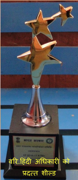
वरि.हिंदी अधिकारी को प्रदत्त शील्ड