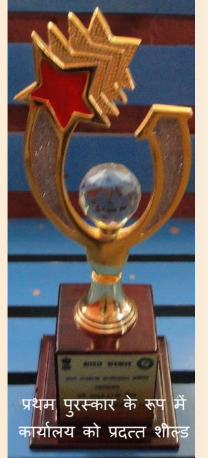
प्रथम पुरस्कार के रूप में कार्यालय को प्रदत्त शील्ड