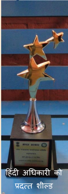
हिंदी अधिकारी को प्रदत्त शील्ड